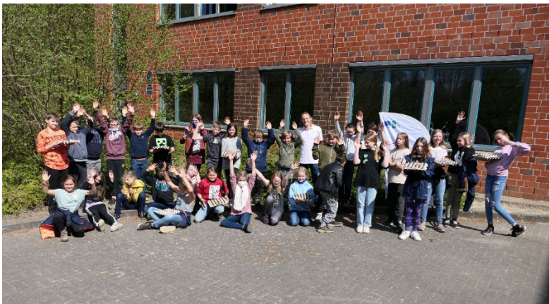
Schon Anfang Mai gab es die erste Aktion mit der Naturpark-Schule Oberschule Hanstedt.