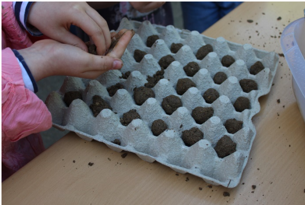
Die Bällchen sollen möglichst schnell trocken und werden auf Eierpappen ausgelegt.