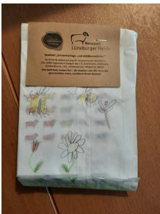
Diese Tüte wurde von Schülerinnen und Schülern der Naturpark-Schule Sprötze-Trelde gestaltet.