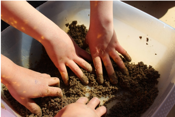
Das Mixen des „Bällchen-Teigs“ war eine große Freude für die Kinder.